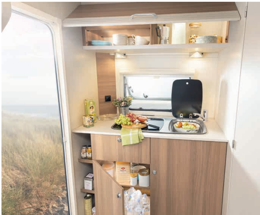
» Placards de pavillon spacieux