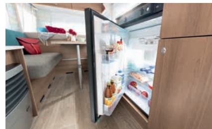
» Spacieux réfrigérateur 81 litres dont 10 litres de congélateur (selon modèle)