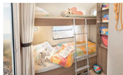
» 2 lits superposés et en option possibilité d'en rajouter un 3ème (selon modèle)