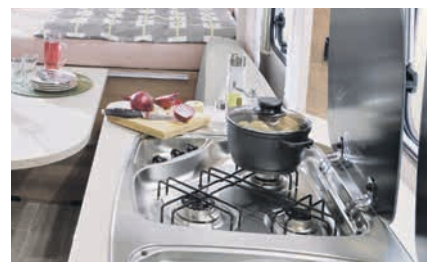
» Plaque de cuisson 3 feux avec allumage manuel