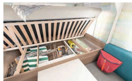
» Matelas relevable permettant un accès facile à la soute pour un rangement optimal