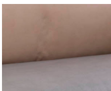
+ Ambiance intérieure : Duke *