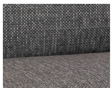
+ Ambiance intérieure : Floyd