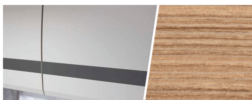
+ Mobilier décor : Rosario Cherry