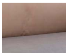
+ Ambiance intérieure : Duke *