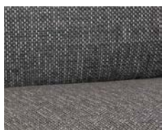
+ Ambiance intérieure : Floyd