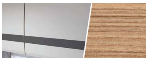
+ Mobilier décor : Rosario Cherry