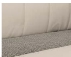
+ Ambiance intérieure : Chaleur