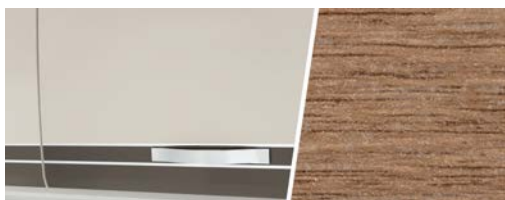
+ Mobilier décor : Chêne de Virginie