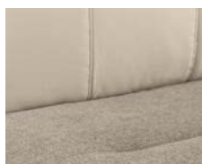
+ Ambiance intérieure : Torcello *