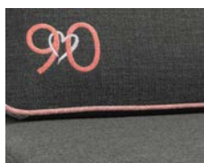
+ Ambiance Visby *