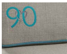
+ Ambiance Fyn