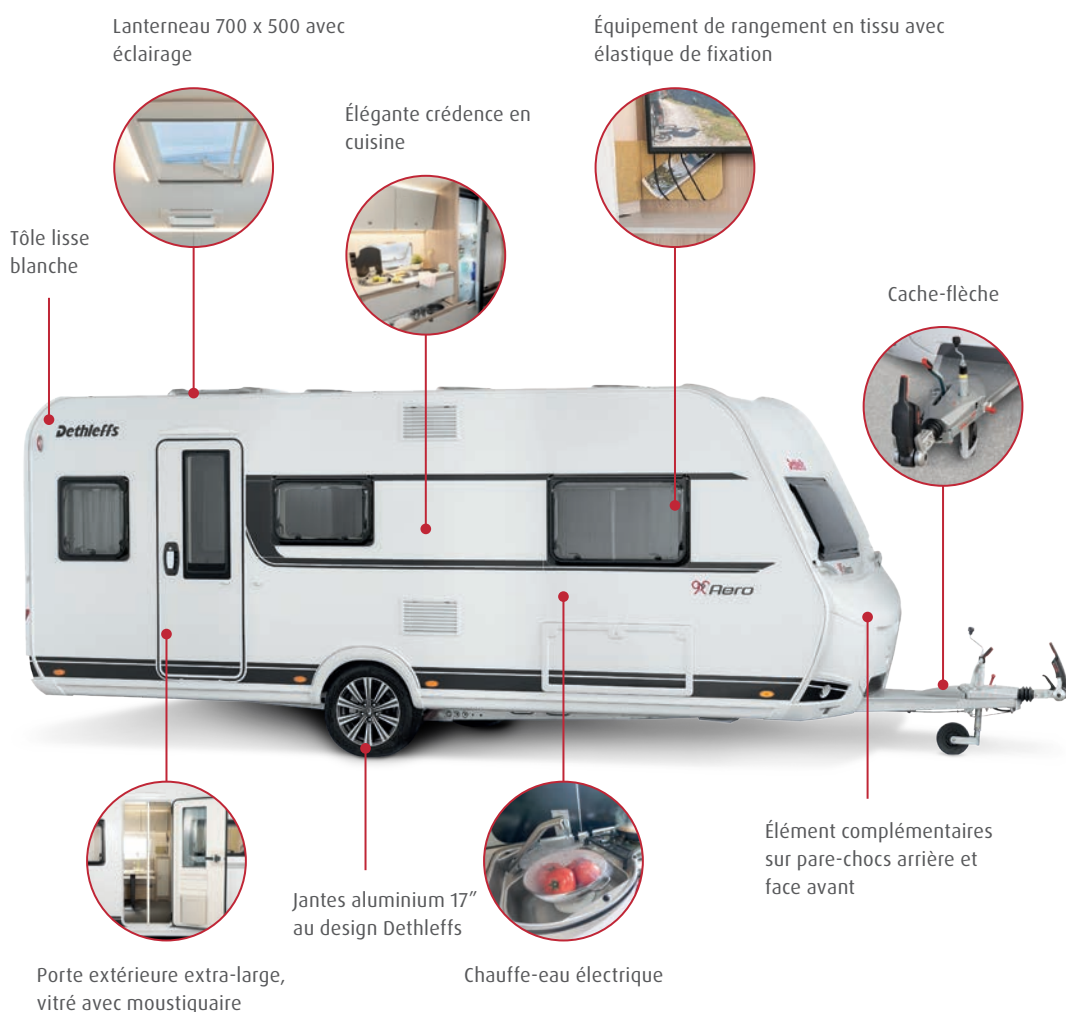
Lanterneau 700 x 500 avec éclairage