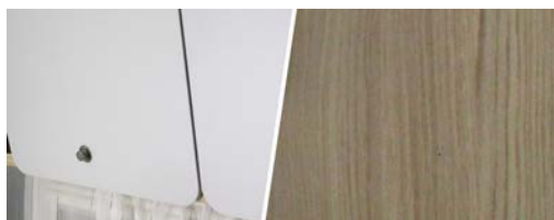
+ Mobilier Maryland Oak