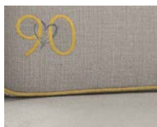
+ Ambiance Skagen *