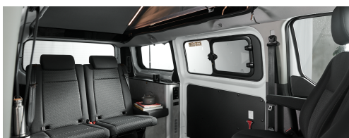
+ Ambiance intérieure Renolit Makalu Pearl Grey