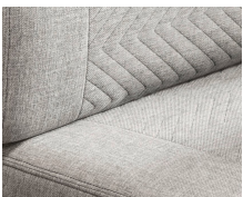
+ Tissu Scandi