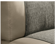
+ Ambiance intérieure Camino