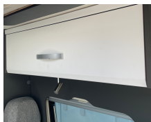
+ Mobilier décor : chêne ambré (Amberes Oak)